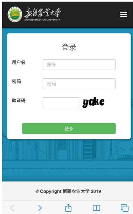
手机、平板电脑界面